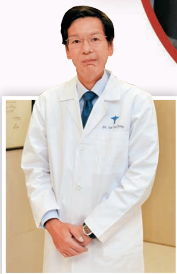
▲ 李德康醫生指出，壓力會誘發過敏病，而長期的過敏病徵亦會造成壓力。