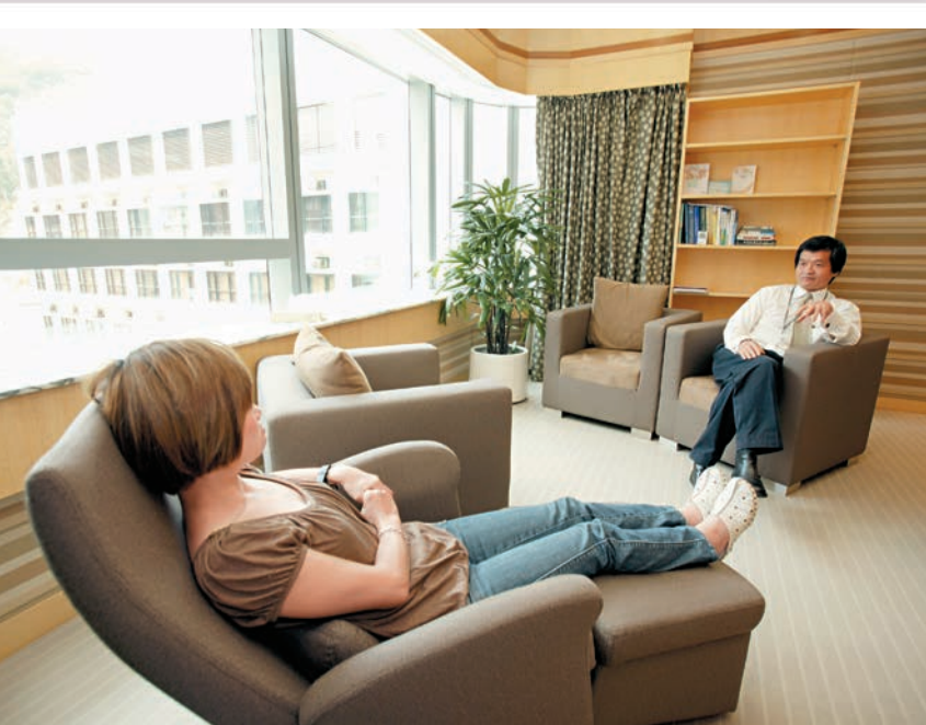
▲ 有壓力問題的嚴重過敏病症患者，可以通過心理輔導，釋除壓力，病徵自然會消失。