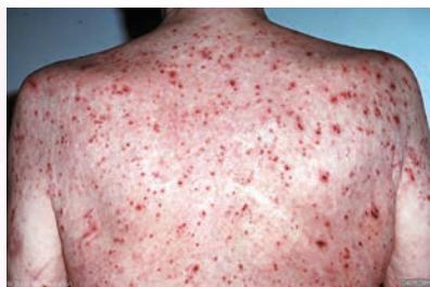
▲ 神經性皮膚炎，患者的癢處只發生在可以用手抓癢的位置。