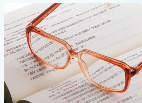
戴老花眼鏡對很多中年人士來說是一種困擾。