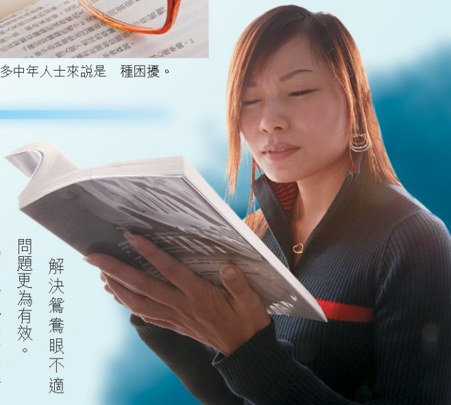
解決鴛鴦眼不適問題更為有效。

「激光矯視手術後，應立即回家休息，切忌到沙塵滾滾的地方，其中一位在術後去施工中的地盤，結果感染細菌，經治療後損失了三成視力。」張醫生說。但他強調，只要術後依足指示回家休息，翌日才滴眼藥水，基本上受感染機會極微。