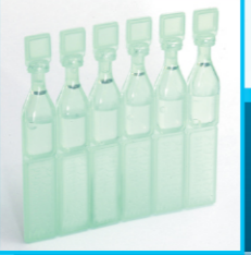
▶ 激光矯視手術後初期會眼乾，只要滴人工淚水滋潤便可。