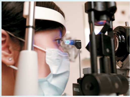
▶ 矯視是否適合自己，如何進行才達到最大利益，必須進行詳細檢查及評估，才能決定。