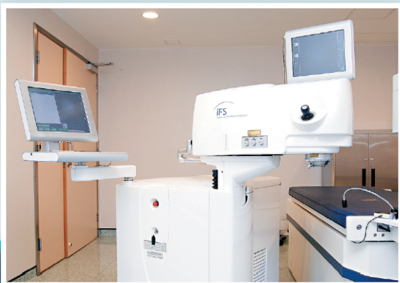
最新的飛秒激光儀器，可將角膜切得更薄，手術後更快癒合。