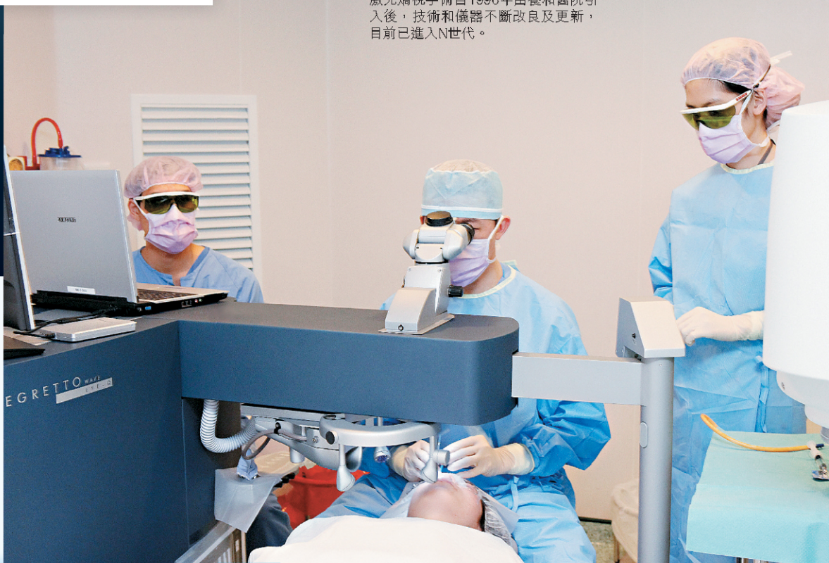
激光矯視手術自1996年由養和醫院引入後，技術和儀器不斷改良及更新，目前已進入N世代。

但經過兩年的臨牀經驗和小心觀察，發現並沒有不良效果，而這手術的最大好處是如果病人不喜歡術後的效果，醫生可以把小光圈取出，角膜便會回復到原來的狀況，不會對角膜造成永久的損害。由於這種手術好處甚多，張醫生打算繼續以這種方法為更多病人改善視力。