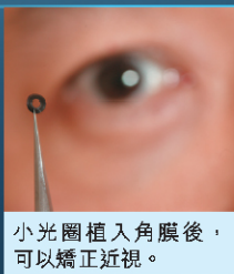
小光圈植入角膜後，可以矯正近視。

在這十年間，全球已做了五千宗個案，單是日本一個視力矯正中心已做了二千個，效果良好。另有一種自動對焦晶體，但由於中距離視力一般，而且有其他更佳方法，故近年已停止用這方法作矯視用途。