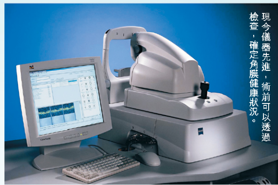
現今儀器先進，術前可以透過檢查，確定角膜健康狀況。